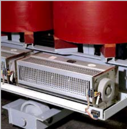
Enfriamiento por ventilación forzada

A continuación se detallan las cantidades, potencias y tensiones de los ventiladores de enfriamiento: