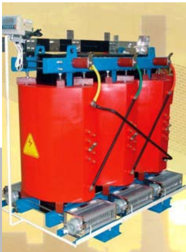
Vista Frontal con terminales de AT

La bobina de alta tensión del transformador está compuesta por alambres de cobre aislado con esmalte que son devanados con equipos de alta precisión. La metodología utilizada para el diseño de los transformadores de LKE, está basada en sofisticados cálculos matemáticos para poder así asegurar su normal funcionamiento con temperatura entre -25\text{ }^{\circ}\text{C} y 155\text{ }^{\circ}\text{C} .