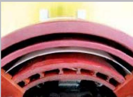
Ranuras para ventilación forzada